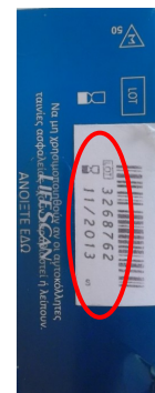
Πλαστή χάρτινη συσκευασία